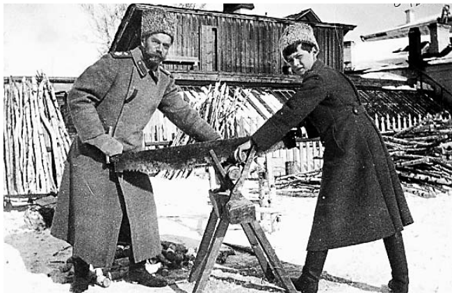
В ссылке в Тобольске

Полностью материал опубликован на сайте «Православие и мир» www.pravmir.ru