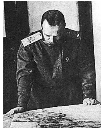
Царская Ставка 1915 год