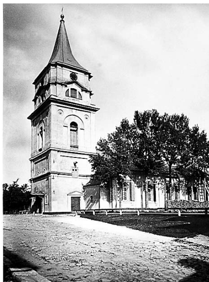
Церковь Св. Михаила в Немецкой слободе

источниками минеральных вод, по целебным свойствам не уступающим Кавказским. В 1722 году сюда приезжал сам Петр I, который пробыл на Истьянском заводе около месяца, пользуясь для лечения открытыми поблизости минеральными водами. Перед отъездом в столицу он собственноручно выковал на заводе кусок железа в 18 пудов и заклеил его своим царским штемпелем. Несколько дней водолечения оказали свое благоприятное действие, и царь с удовлетворением известил письмом Екатерину: «Воды, слава Богу, действуют изрядно, а особенно урину гонят не меньше олонецких; только аппетит не такой, однако же есть».