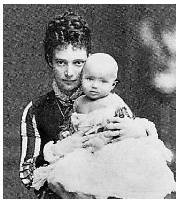
С матерью, Цесаревной Марией Федоровной. 1868 год

Февральской революции 1917 года и находился вместе с семьей под домашним арестом в царском дворце. Летом 1917 года, по решению Временного правительства, был вместе с семьей отправлен в ссылку в Тобольск, а весной 1918 года перемещён большевиками в Екатеринбург, где был расстрелян в июле 1918 года, вместе с семьей и приближенными. 50 лет его жизни, вместившей все эти события, – в фотографиях.