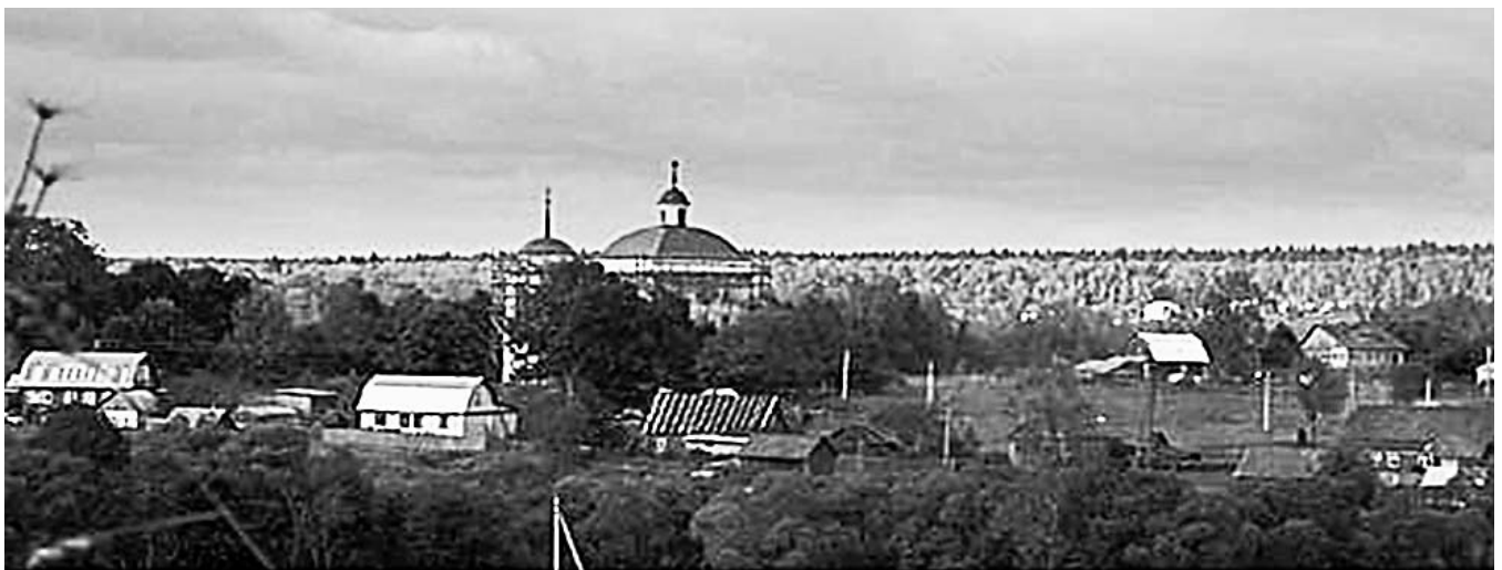
Вышегород. Набережная слобода.