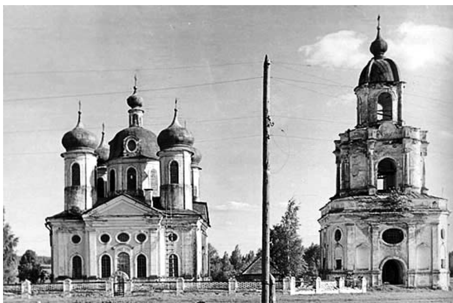
Преображенская церковь. Спас-Косицы

Вышегород и приселки – земля пограничная, здесь проходила граница с Литовским княжеством, потому эти земли не обошли стороной польские и шведские захватчики, вплоть до 17 века не раз разрушая и сжигая дотла избы и амбары, храмы и меленки. Вышегород вследствие разрушений и перемещения границ, отодвинувши-